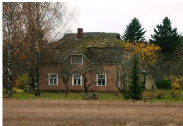
Kissalan päärakennus on Korven tien varrella sen vasemmassa puolella n. 500 m Korven aseman kohdalta kentälle näin