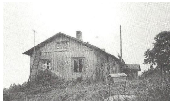
Högdalin torpan päärakennus v. 1967 jälkeen, jolloin se oli Nurmijärven kunnan omistuksessa. Rakennus oli B1 väylän mutkan ja sisääntulotien välisellä mäellä. Täällä kuvattiin kohtauksia elokuvaan Mies tuli taloon.